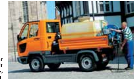
Mit 140 bar Wasserdruck spült FUMO Schmutz aus dem Kanal.