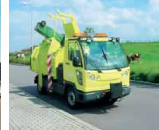
FUMO schafft Platz: sein Behälter nimmt bis zu 4,9 m³ auf und verdichtet hydraulisch im Verhältnis 5:1.