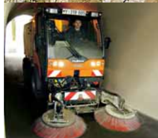
TREMO Carrier, der Schmalspurgeräteträger, im extrem engen Kehreinsatz.