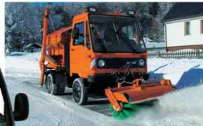
Mit Kombistreuer auf dem Absatzkipppaufbau und Vorbaukehrmaschine meistert der M 26 den Wintereinsatz.

Auch wenn es draußen kalt wird, hat es der Fahrer in der modernen Space Frame-Kabine des FUMO warm und bequem.