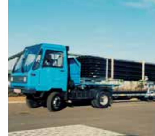
Nur 1,59 m breit, 2,24 m hoch, aber bis zu 8 m lang. Der M 26 mit Langmaterial-Nachläufer.