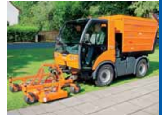
Große Flächen und extrem enge Plätze: TREMO Carrier mit Mäh-/Saugkombination.