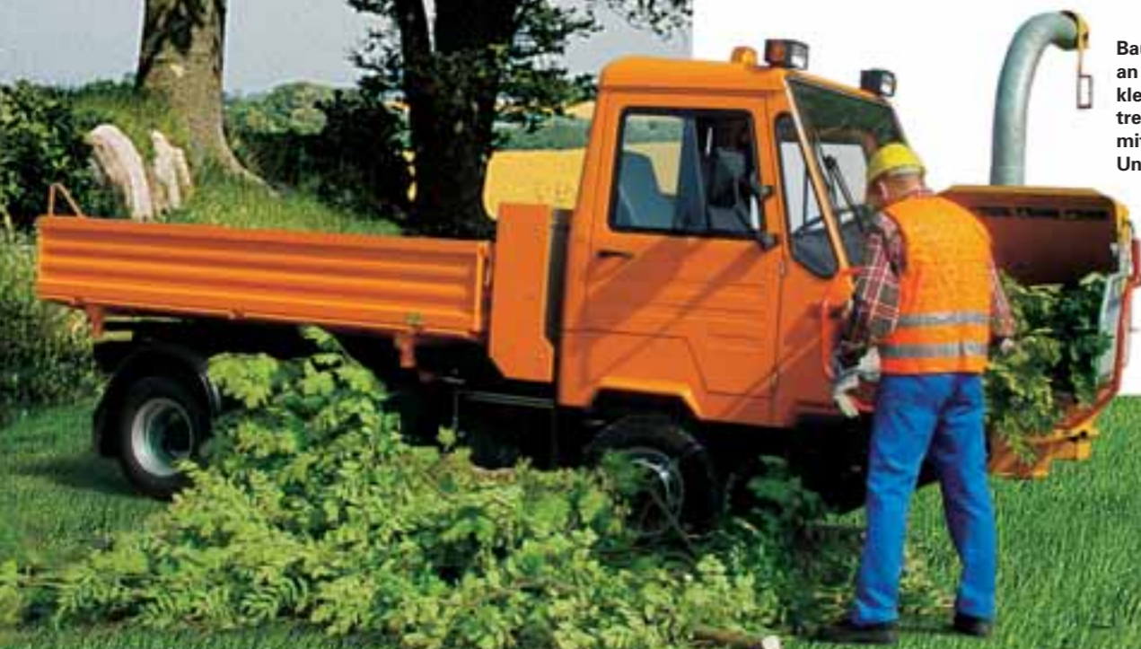
Baumschnitt gleich an Ort und Stelle zerkleinern. Der M 26 treibt den Häcksler mit seiner starken Universalhydraulik an.