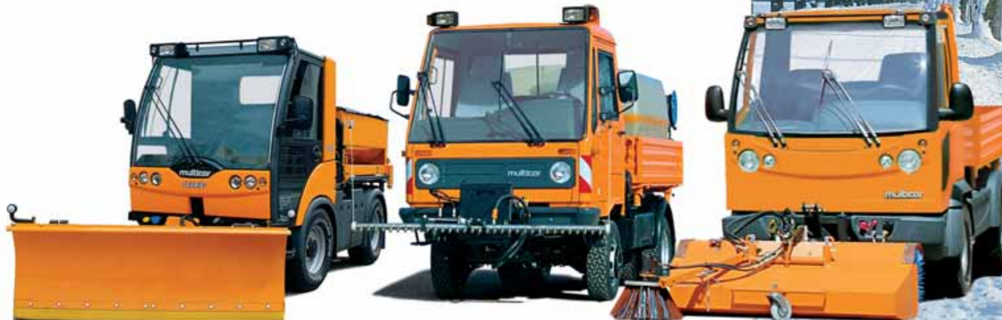
TREMO Carrier: 1,30 m breit