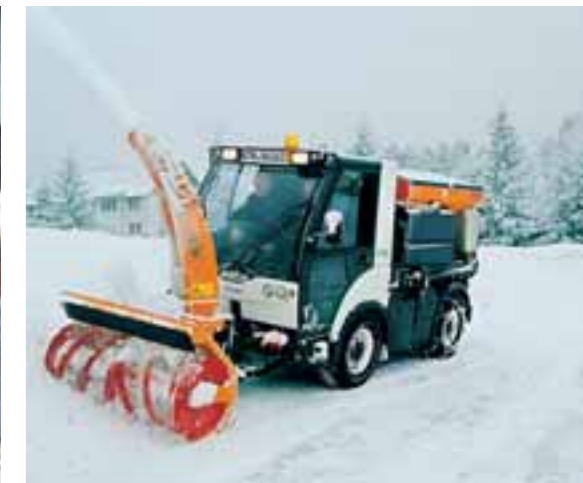
TREMO Carrier: Mit hydrostatischem Fahrtrieb beim Schneefräs-Einsatz.