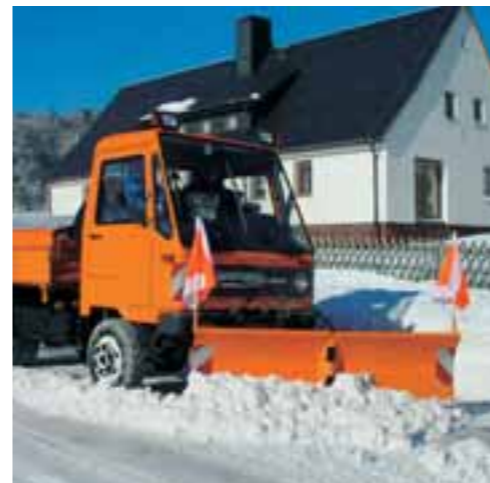
Der M 26 mit Universalhydraulik schiebt sich durch Schnee und Eis.