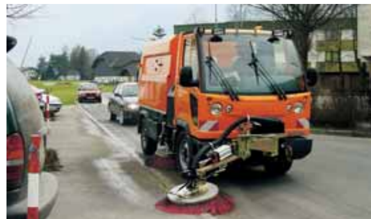
Mit einem Arbeitsdruck von bis zu 300 bar steuern Sie den Volumenstrom für die Saugkehrmaschine komfortabel von der Mittelkonsole aus.