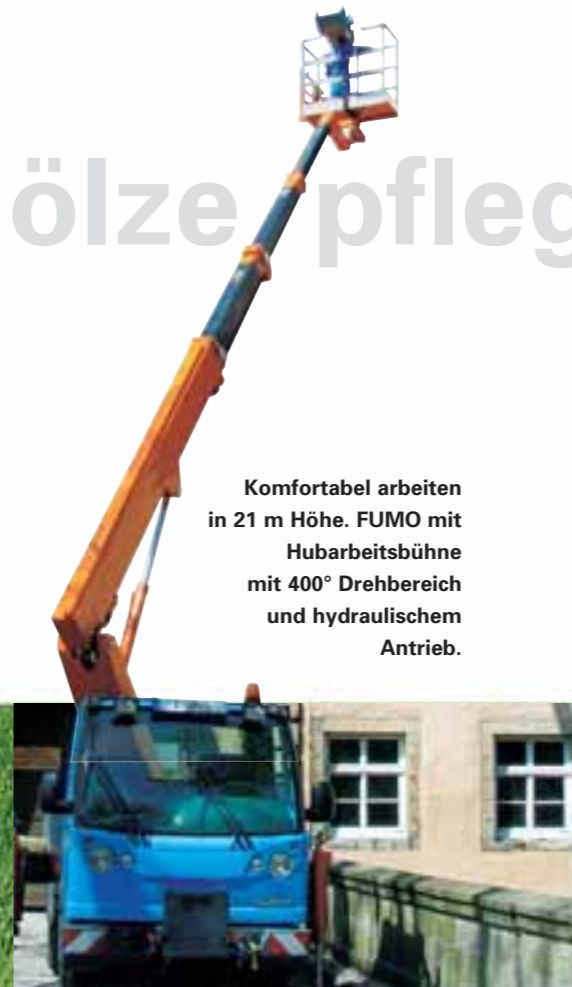
Komfortabel arbeiten in 21 m Höhe. FUMO mit Hubarbeitsbühne mit 400° Drehbereich und hydraulischem Antrieb.