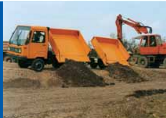
Mit bis zu 3,1 m³ Ladevolumen transportiert der M 26 mit langem Radstand und Hänger auf und abseits der Straße.