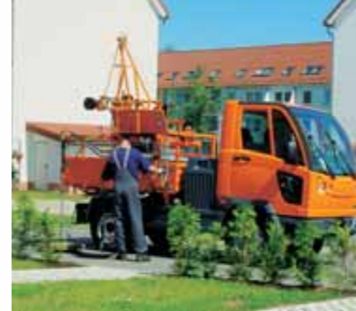
Kanaldeckel anheben, Sinkkasten hydraulisch säubern. Mit FUMO sind Sie schnell startbereit.

Gerade auch in nicht alltäglichen Aufgaben entdecken Sie die vielen Talente der Multicar-Familie. Über die hydraulischen Anschlüsse vorne und hinten treiben Sie, völlig unabhängig von stationären Stromquellen, zum Beispiel viele Geräte zur Reparatur und Instandhaltung an. Das Aufbau-Kugelwechselsystem ist Ihre Andockstelle für rund hundert mögliche Spezialaufbauten. Daneben ergänzen die vielfältigen Transporter-Aufbauten das Spektrum nochmals entscheidend.