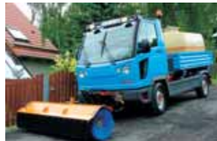
FUMO beseitigt mit Kehrwalze und Wasserfass die letzten Spuren.