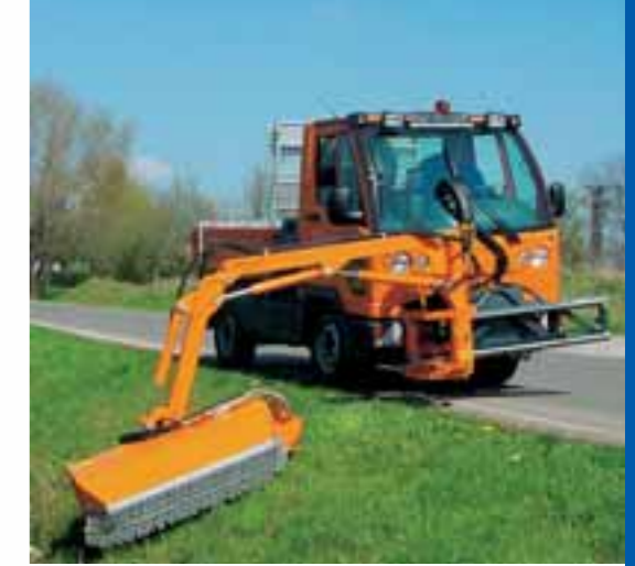
Mit Dreikreishydraulik und hydrostatischem Antrieb pflegt FUMO mit Schlegelmähkopf fein dosiert Böschungen und Bankette.