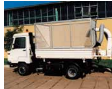
Bis zu 6,6 m³ Laub saugt der M 26 mit langem Radstand in seinen Gitteraufsatz.