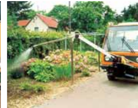
Unabhängig von einer stationären Wasserversorgung gießen Sie mit dem M 26 auch bei nur 1,60 m Durchfahrbreite.