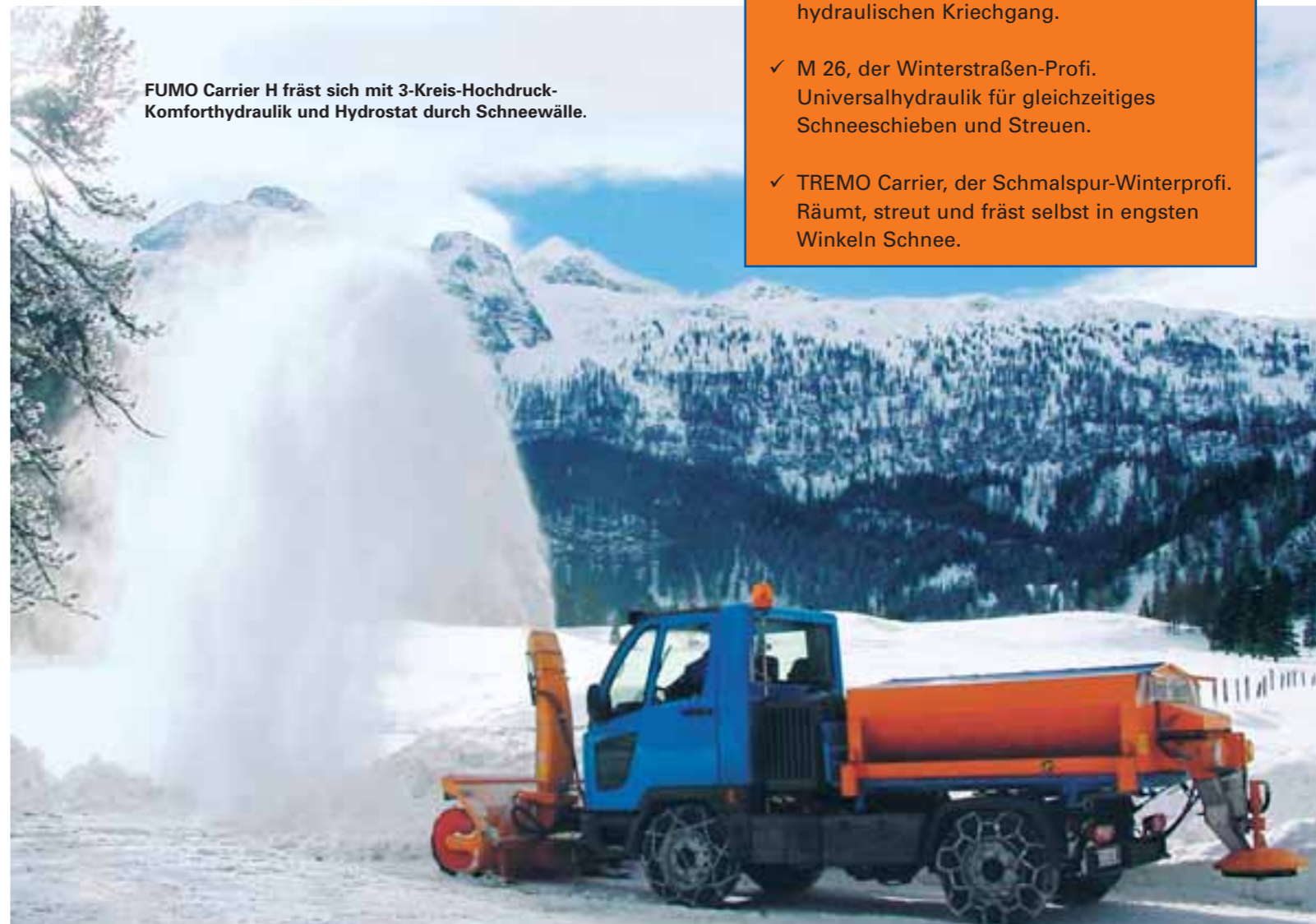
FUMO Carrier H fräst sich mit 3-Kreis-Hochdruck-Komforthydraulik und Hydrostat durch Schneewälle.

Auch wenn es draußen kalt wird, hat es der Fahrer in der modernen Space Frame-Kabine des FUMO warm und bequem.