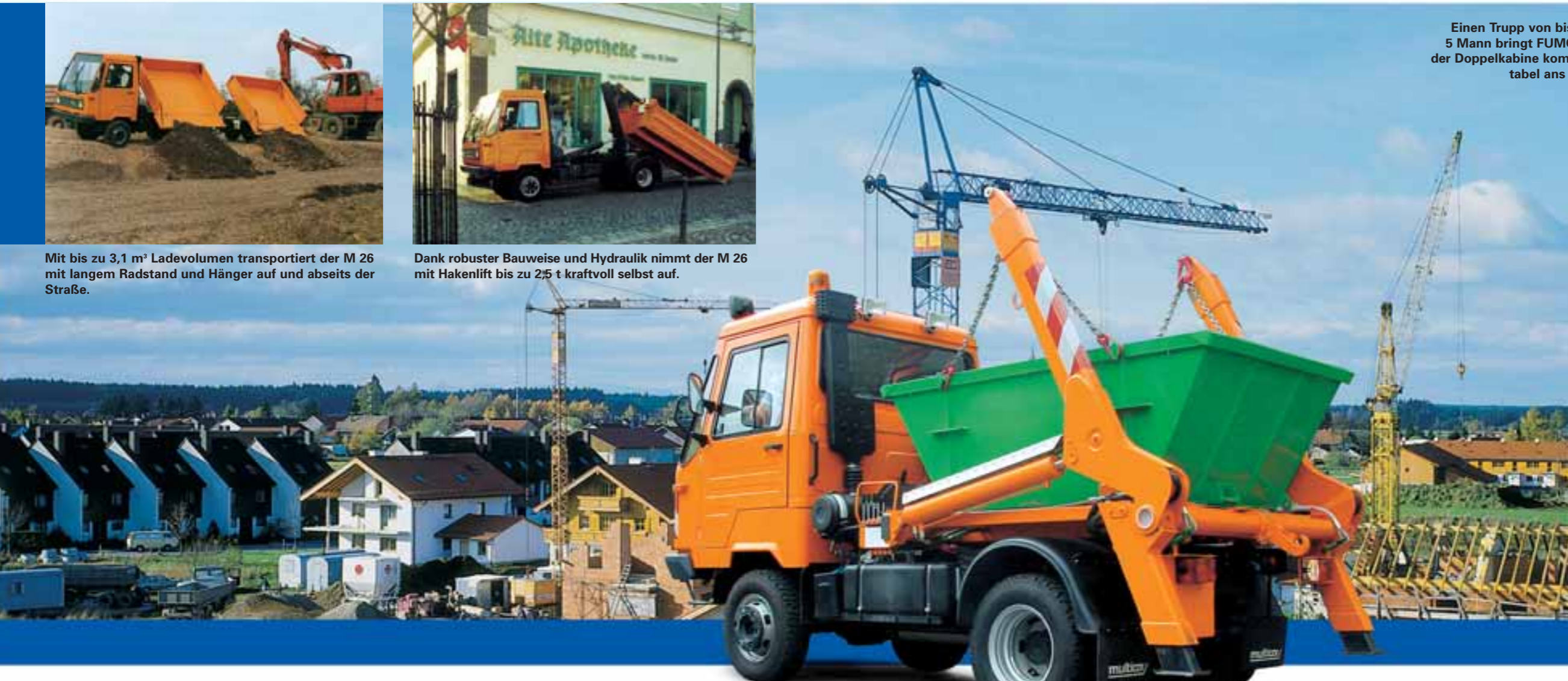
Mit Einkreishydraulik und einer Nutzlast von bis zu 2,3 t entsorgt der M 26 mit Absetzkipper auch aus engen Hofeinfahrten und unzugänglichen Baustellen.