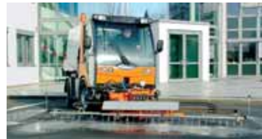
Mit Edelstahlprühbalken und Wassertank reinigt der TREMO Carrier Straßen und Plätze.

Wendig, kompakt und allzeit bereit. Ein Multicar ist auf allen Straßen und Radwegen Ihrer Stadt zuhause. Mit Gardemaßen von rund 1,60 m Breite (TREMO Carrier sogar nur 1,30 m) und ca. 2,20 m Höhe passen FUMO, M 26 und TREMO Carrier sogar auf Radwege und durch enge Torbögen. Mit ihren kraftvollen Motoren reihen sie sich unauffällig in den fließenden Verkehr ein. Mit leistungsstarken Bremsen stoppen sie in kürzester Zeit. Und kommen mit rund 5 m Wenderadius um die engsten Winkel.