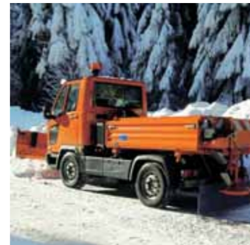
Die vorderen und hinteren Hydraulikan Anschlüsse des FUMO treiben Anbaugeräte mit bis zu 300 bar an.