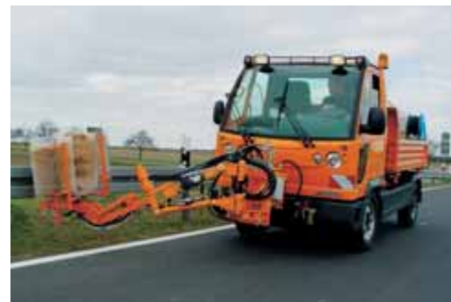
Leitpfosten- und Leitplankenwaschen mit FUMO. Bis zu 30 kW hydraulische Leistung treibt Geräte kraftvoll an.