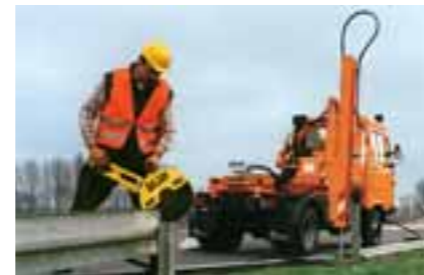
Der Generator des M 26 liefert Strom zum Betreiben von Arbeitsgeräten (z.B. Trennsäge und Schrauber).