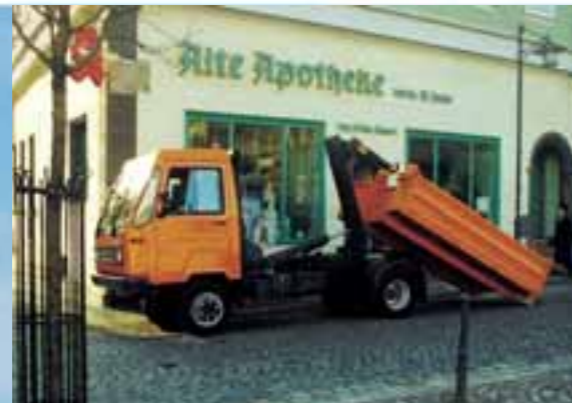
Dank robuster Bauweise und Hydraulik nimmt der M 26 mit Hakenlift bis zu 2,5 t kraftvoll selbst auf.