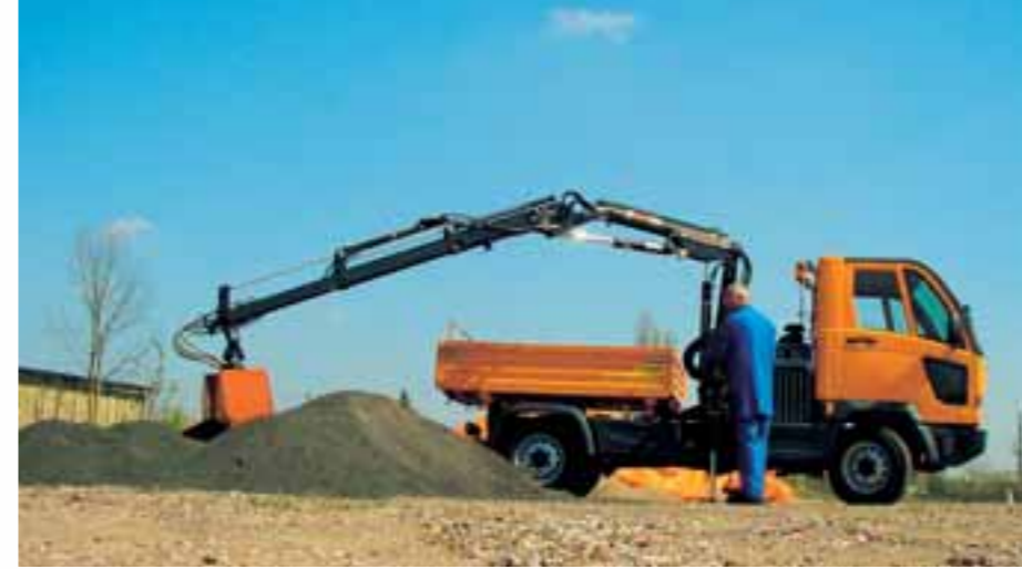
FUMO glänzt auch abseits der Straße mit 4x4-Allradantrieb, hervorragender Geländegängigkeit und einem Dreiseitenkipper mit 1,3 m³ Ladevolumen.

Für die einen ist es ein Stück Lebensqualität, für die anderen eine ganze Menge Arbeit: Der Sommer. Anlegen, pflanzen, schneiden, mähen, mulchen, gießen, häckseln und dabei gleichzeitig Wasser, Sand, Erde oder Baumschnitt transportieren. Gut, wenn Ihr Partner ein echtes Multitalent ist, gleichzeitig Geräte trägt, antreibt und große Lasten transportiert. Eben ein echter Multicar.