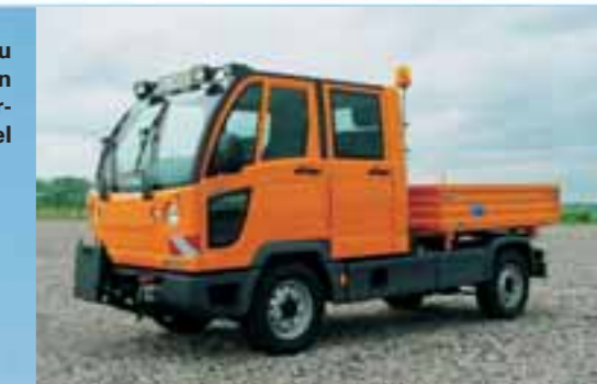
Einen Trupp von bis zu 5 Mann bringt FUMO in der Doppelkabine komfortabel ans Ziel